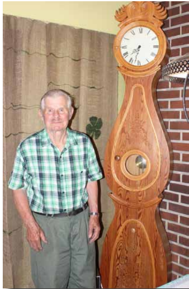
Taitelija työnsä ääressä. Auloksen omakätisesti rakentama Könnin kello vangitsee katseet olohuoneessa.

- Naapurit harvenevat; meilläkään ei enää ole naapureina kuin kuusi ihmistä. Ennen, kuusikymmentäluvulla, tilaisuuksiin tultiin suksilla ja hevosilla ja tuvat olivat täynnä. Silloin kylässäkin viiden kilometrin päässä oli kaksi isoa kauppa, joista tilattiin kahvia ja sokeria, toivat kotiin. Muut tar-